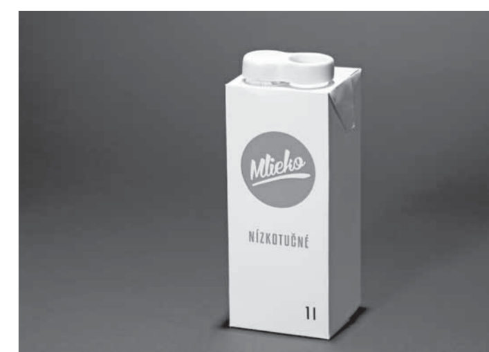
Matúš Mitas, Obal na mlieko

– podľa TS upr., foto: Filip Sach Zdroj: http://mlady-obal.cz/mlady-obal-2013/vitezove/galerie/g266 –