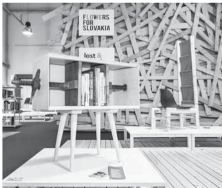
—upr. podľa TS - foto z archívu FLS—

Design Week mali diváci možnosť vidieť unikátnu kolekciu nábytku a interiérových doplnkov, ktorá vznikla počas tohto týždenného letného workshopu v Banskej Štiavnici. V kolekcii dominuje drevený nábytok. Stoličky, lavice, stoly, úložné skrinky, či dokonca detská kolíska prešli dôkladnou rekonštrukciou, aby boli nie len vizuálne atraktívne, ale predovšetkým plne funkčné. Všímavý pozorovateľ však rozpozná v netradičných spojeniach i viaceré pracovné nástroje, ktoré boli pôvodne určené predovšetkým ženám na spracovávanie konope a ľanu, navíjanie priadze, mútenie masla, miesenie cesta alebo zabíjačka. Podobne, ako aj prvá kolekcia projektu Flowers for Slovakia, je teda aj kolekcia Lost & Found pripravená cestovať po európskych mestách, v ktorých sa konajú zásadné prehliadky súčasného dizajnu. Po premiére na domácom festivale Bratislava Design Week v showroome spoločnosti Techo putovala výstava do pražského Vitra showroomu, kde prezentovala Slovensko v rámci 13. ročníka Designbloku. No a v roku 2014 organizátori plánujú s kolekciou navštíviť metropoly Miláno, Berlín, Londýn a Viedeň.